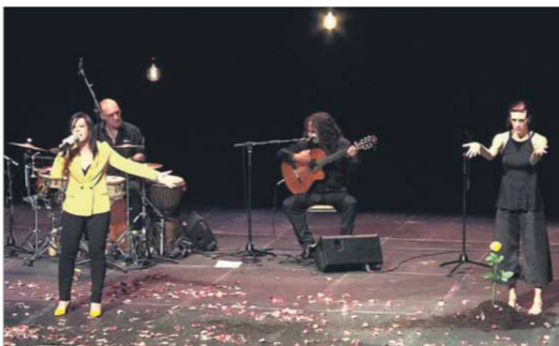
La professionalitat i qualitat musical i les emocions van ser la clau per a la comunió amb el públic ■ J.B.B.

Tal com havia anunciat la mateixa Neus, en les prop de dues hores d'espectacle hi va haver temps per fer repàs de relectures molt personals de cançons "poc previsibles", com ara Alè i A força de nits . Però també hi havia preparades cançons encara plenes de força per les quals els temps sembla no haver passat: La gallineta o L'estaca . Un repertori que es va seleccionar a partir d'una petita enquesta a les xarxes perquè aquest projecte "no es quedés només en les cançons